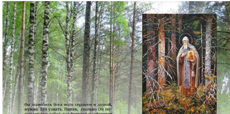
Преподобный Нил Столобенский