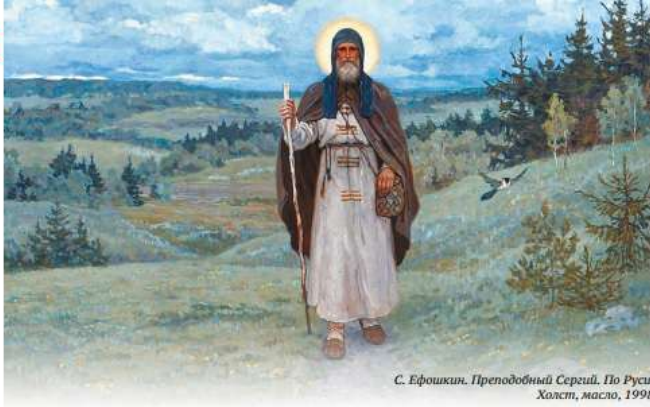
С. Ефрекин. Преподобный Сергий. По Руси. Холст, масло, 1998