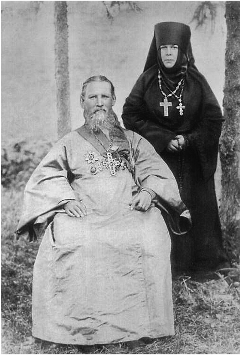
Игуменья Таисия со св. пр. Иоанном Кронштадтским.