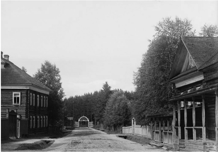
Въезд в Леушинский монастырь. 1909 г.