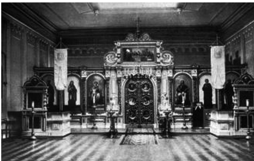
Внутренний вид храма в Павловском институте. Фото конца XIX века.