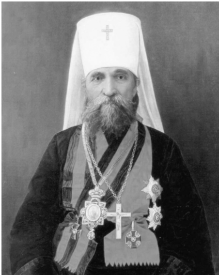
Священномученик Владимир (Богоявленский). Митрополит Киевский и Галицкий, ранее викарий Новгородский. 1848 – 1918 гг.