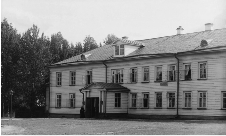
Леушинский монастырь, Игуменский корпус. Фото С.М. Прокудина-Горского 1909 г.