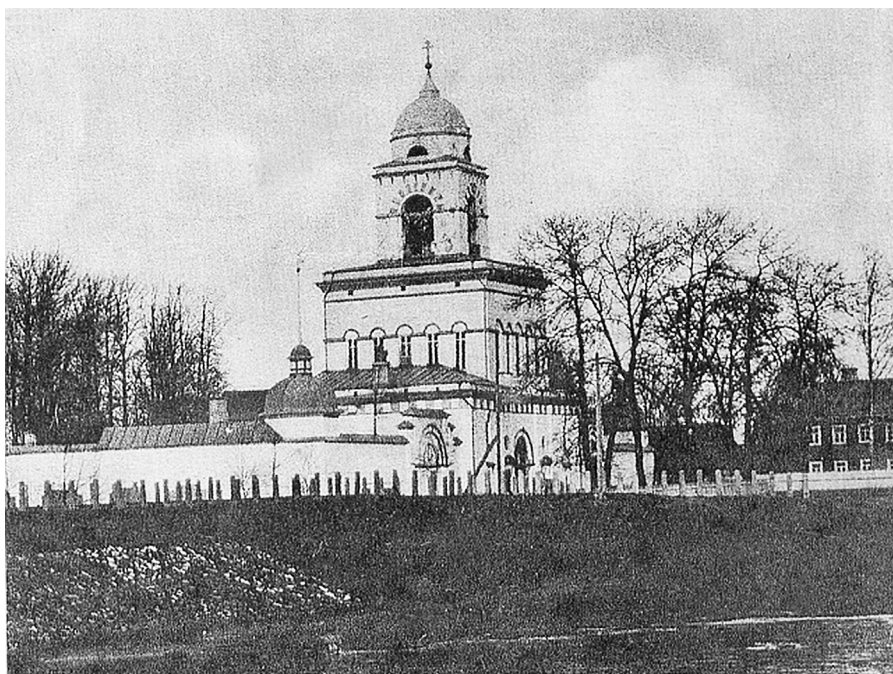
Введенский женский монастырь в Тихвине. Фото начала XX века.