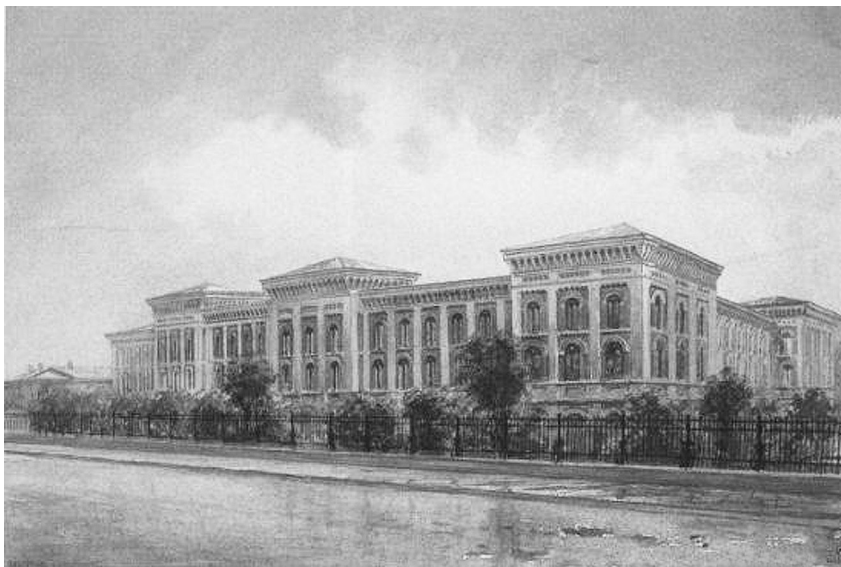
К.Э. Гефтлер. Павловский институт в Санкт-Петербурге. 80-е гг. XIX в. Акварель.