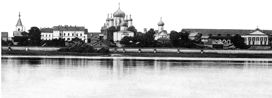
Покровский Зверин монастырь в Новгороде. Фото начала XX века.