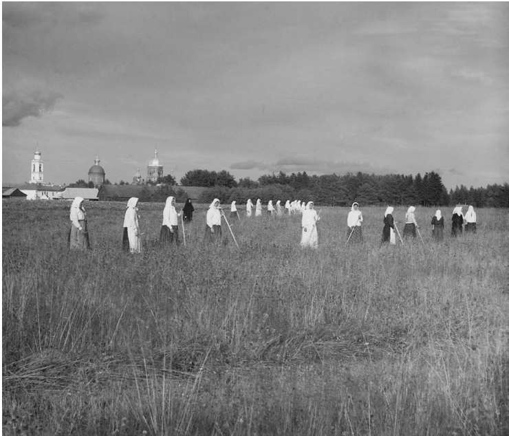
Монастырский сенокос. 1909 г.