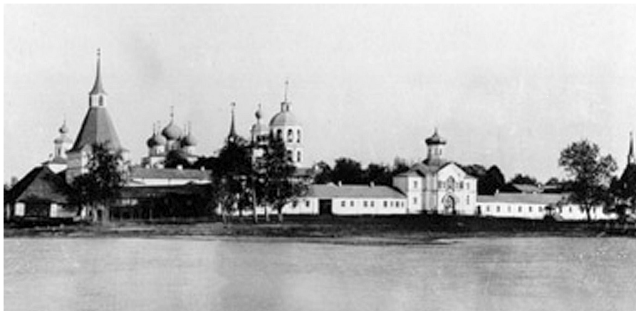
Валдайский Иверский Богородицкий мужской монастырь Фото начала XX века.