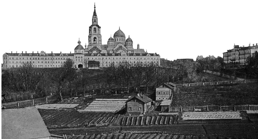
Спасо-Преображенский Валаамский монастырь. Фото начала XX века.