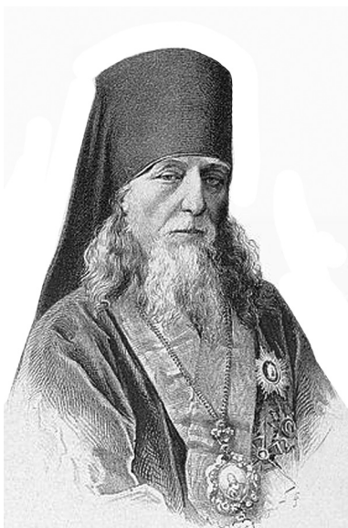
Епископ Самарский и Ставропольский Серафим (Протопопов), ранее викарий Новгородский. 1818 – 1891 гг.