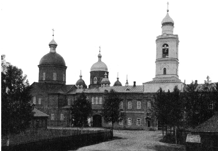
Леушинский монастырь. 1909