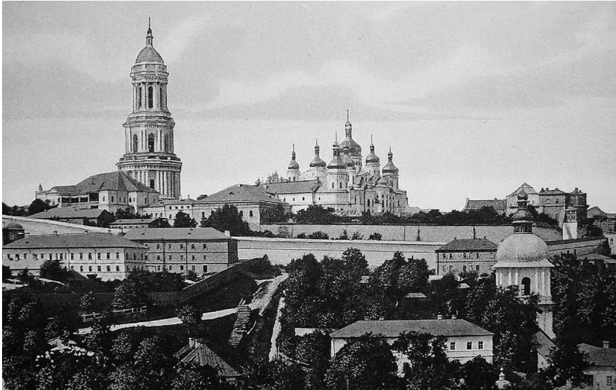
Свято-Успенская Киево-Печерская лавра. Фото начала XX века.