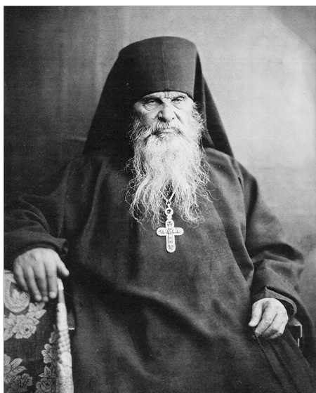
Наместник Валаамского монастыря игумен Дамаскин (Кононов). 1795–1881 гг.