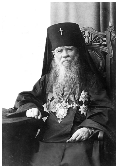
Архиепископ Воронежский и Задонский Анастасий (Добрадин), ранее викарий Новгородский. 1828–1913 гг.