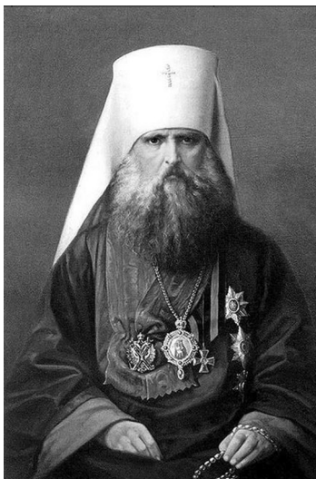
Митрополит Иоанникий (Руднев). Фото 90-х гг. XIX века.