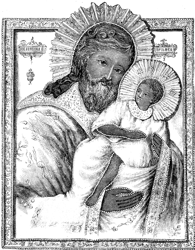
ЎБРАЗЪ СВ. СѢШОНА БГОПРІИЦА, НАХОДЯЩІЙСЯ ВЪ ПОКРѢВСКОМЪ ДѢВІЧЬЕМЪ ЗВѢРІНСКОМЪ МОНАСТЫРѢ ВЪ НѢВГОРОДѢ.