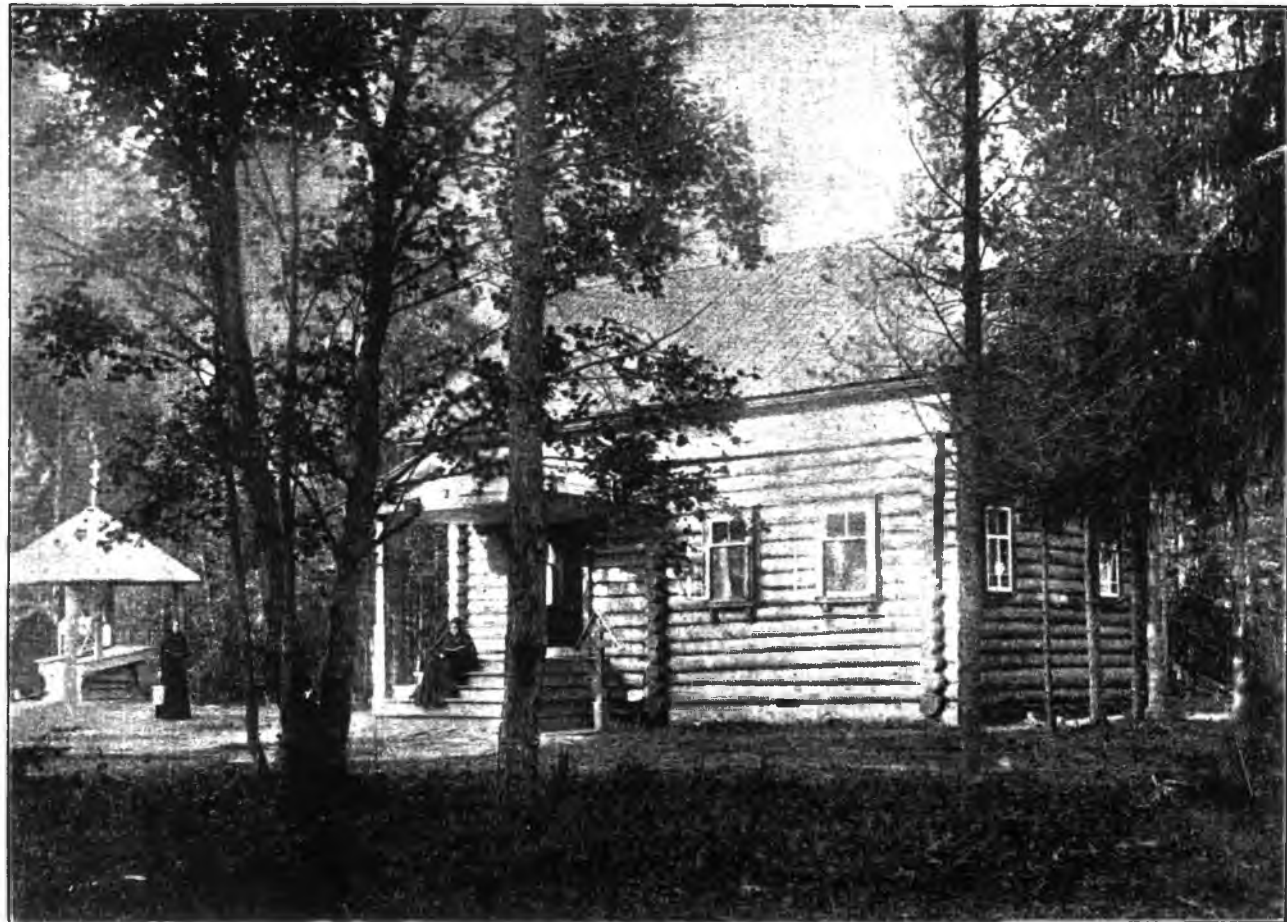
«Пустынька» или «Крестикъ» въ первоначальномъ видѣ.