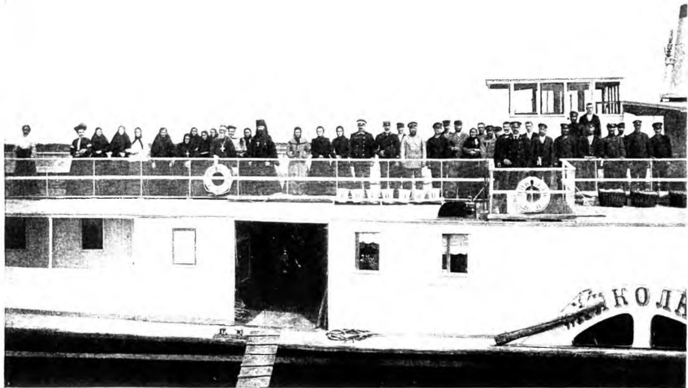
Поѣздка по Волгѣ.