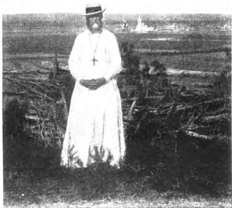
О. Іоаннъ въ подрясникѣ.