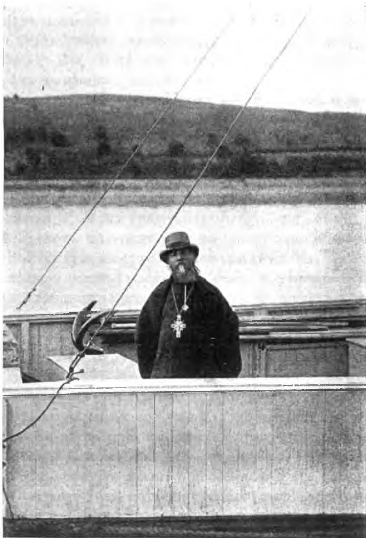
О. Іоаннъ на борту парохода.